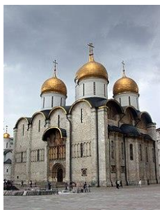
1. Успенский собор в Московском Кремле