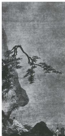
Ма Юань. Лунный свет. Живопись тушью на шелке. XII-XIII вв.

2. Какие эмоциональные доминанты, по Вашему мнению, существуют в каждом произведении?