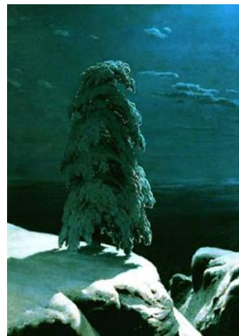
Иван Шишкин. На Севере диком..., 1891.

Творческая составляющая задания может быть усложнена предложением составить словесное описание замысла пейзажа – как заказа художнику, указав желаемую композицию, ракурс, характерные черты изображаемого и способы их достижения.