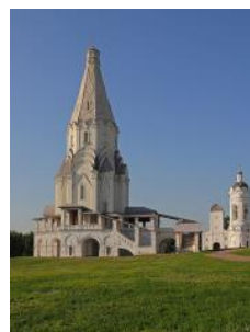
3. Церковь Вознесения Господня в Коломенском (Москва)